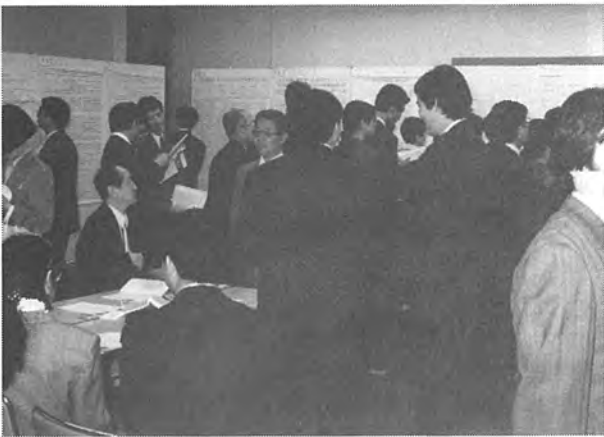
ポスター展示会場