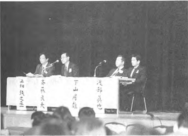
シンポジウム風景